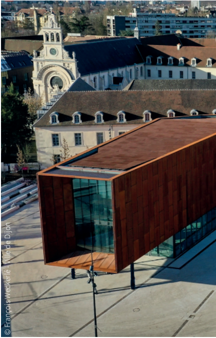
Le canon de lumière sur le parvis de la Cité