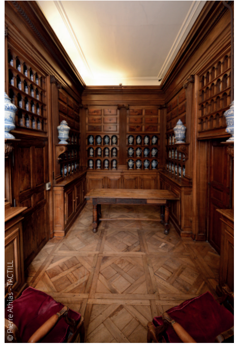
L'apothicairerie et sa collection de pots

L'apothicairerie est visible, gratuitement, en visitant le 1204 - Centre d'interprétation de l'architecture et du patrimoine.